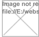
Image not readable or empty file:///E:/webs/maria-de-huerta/sites/default/files/sites/default/files/feria_medieval_2012.png